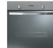
Horno encastrable acero inox