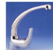
Grifo monomando cromado