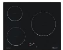
Placa vitroceramica 3 zonas Control digital