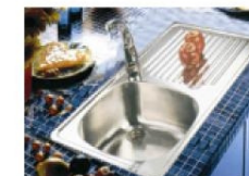
Fregadero 1 seno y 1 escurridor