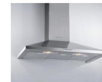
Campana decorativa 90cm acero inox